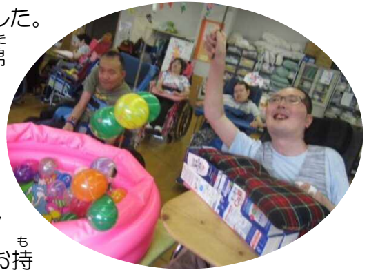
♪「こんなにたくさん釣れたよー」 と笑顔で自慢!

お祭り当日は『綿あめ屋さん』が出店。美味しい綿あめを笑顔でほおばりました(*^_^*)、その他、『ヨーヨー釣り』『くじ引き』の出店もあり、それぞれ真剣にヨーヨー釣りをし、くじ引きで運試しをしました。大当たりの人も、ハズレの人も大盛り上がり！ハズレでもマンボウ特製のかわいいポケットティッシュをお持ち帰りいただきました♪