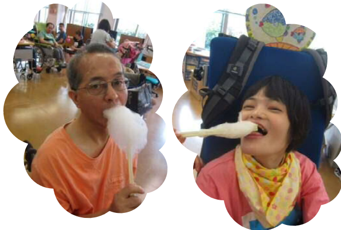
♪あま〜い香りに皆わくわく♪パクッと食べたらなんだが懐かしい味が・・・ふわふわ綿あめに満面の笑顔でした!

皆で飾り付けをしたお祭りを楽しんだ後はバッチリ決め顔で集合写真を撮り充実した一日を過ごしました!